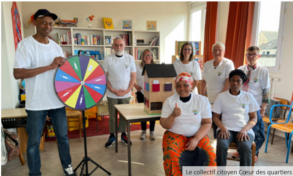
Le collectif citoyen Cœur des quartiers