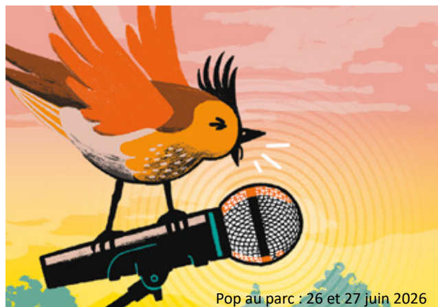
Pop au parc : 26 et 27 juin 2026