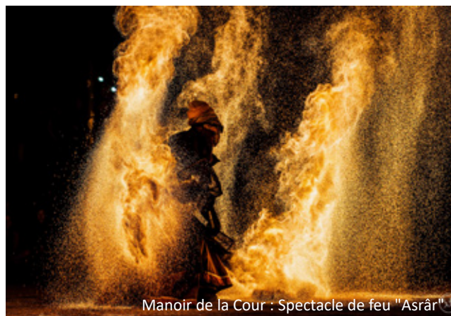
Manoir de la Cour : Spectacle de feu "Asrâr"