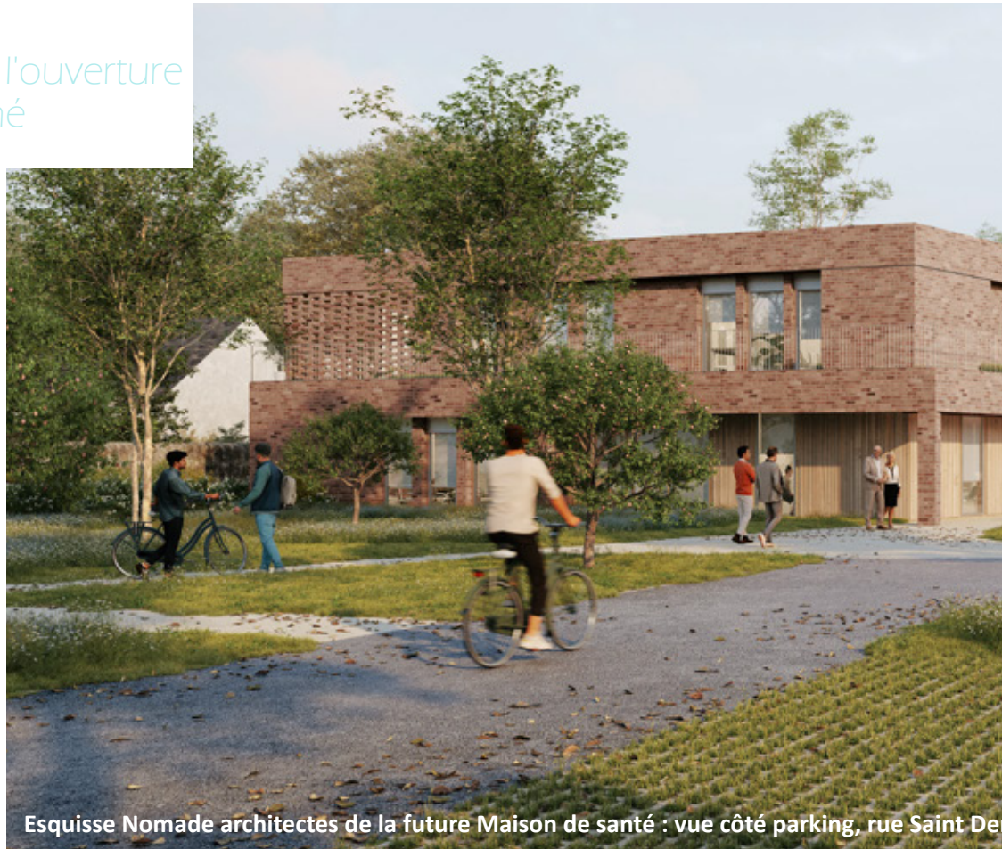
Esquisse Nomade architectes de la future Maison de santé : vue côté parking, rue Saint Denis

En septembre 2023, s'en est suivie une rencontre avec les habitants dans le but