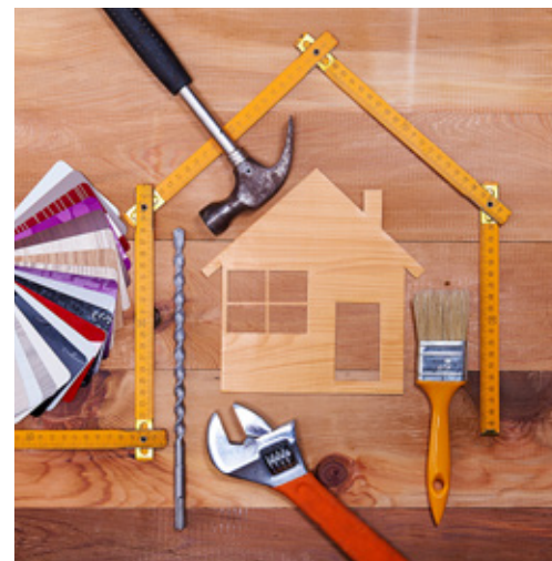
*Conseil d'architecture, d'urbanisme et d'environnement de la Sarthe

RDV Samedi 1 er juin de 14h à 18h , salle Madeleine Marie, 25 rue Saint Denis, à Sablé-sur-Sarthe - Entrée gratuite En présence des partenaires Soliha, le CAUE, le CICAT, Sarha et Auddicé