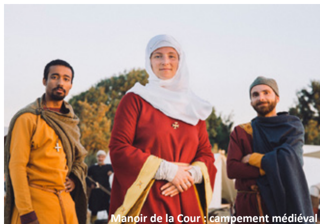
Manoir de la Cour : campement médiéval