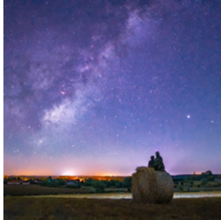
jm.pics_nature Le Bailleul