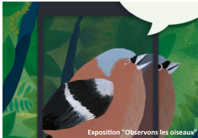
Exposition "Observons les oiseaux"

Campement « Le costume médiéval en Orient » · Manoir de la Cour, Asnières-sur-Vègre